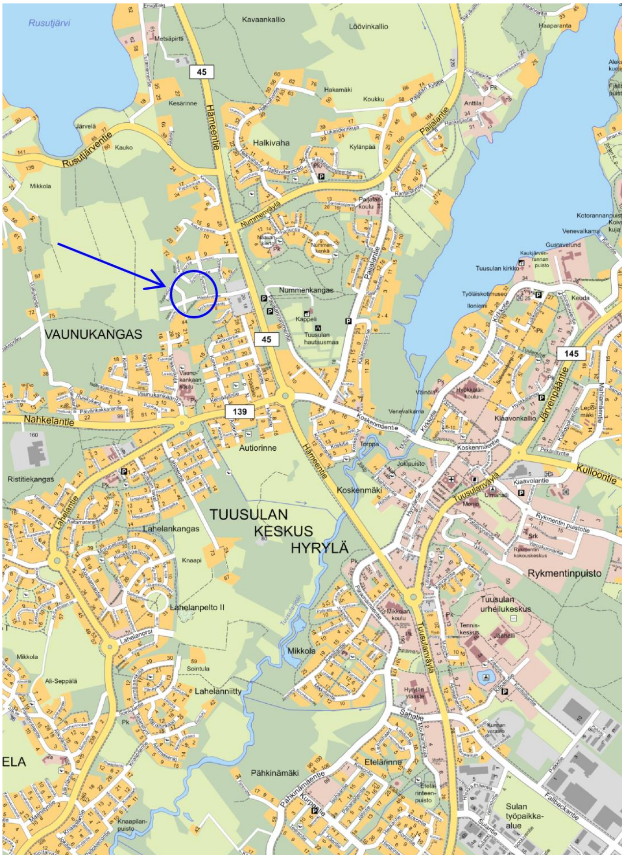
Ote opaskartasta, johon ko. alue rajattu