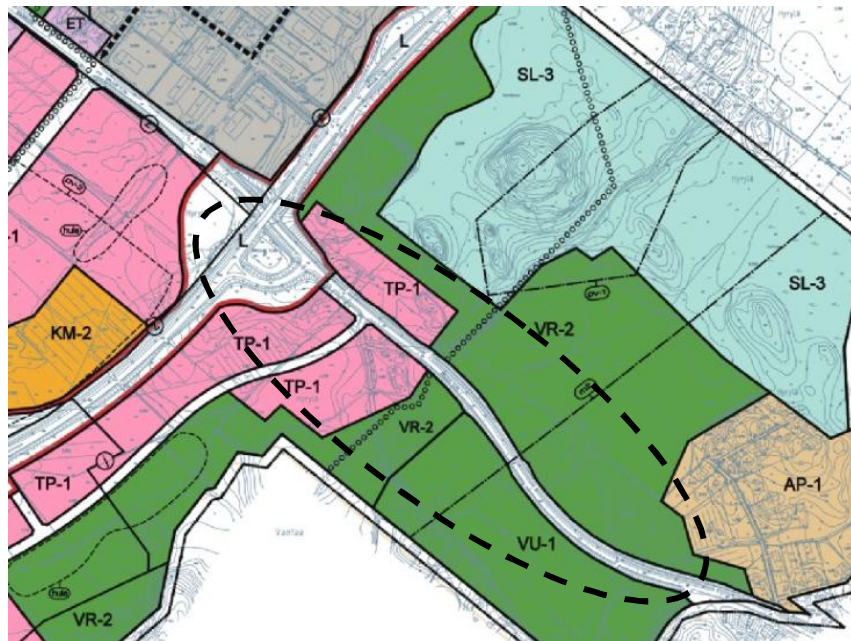
Ote Sulan oikeusvaikutteisesta osayleiskaavasta

Fallbackantien varteen on Sulan osayleiskaavassa merkitty työpaikkatoimintojen kortteleita TP-1 –merkinnällä lähelle ohikulkutien liittymää. Tästä kaakkoon on merkitty virkistyskäytön alueita mm. maakuntakaavan ohjausvaikutuksesta johtuen. TP-1 –alueiden asemakaavoittaminen ei ole kaavoitussuunnitelmassa ja ko. alueet ovat osin yksityisen omistuksessa. Kunta omistaa n. 2-3 ha TP-1:ksi merkittyä aluetta. Ottaen huomioon maanhankinta- tai kaavoituksen käynnistämissopimustarpeen, ei asemakaavatyön käynnistäminen ole vielä ajankohtaista. Neuvotteluja maanhankinnasta tai kaavan laatimisesta käydään resurssien puitteissa.