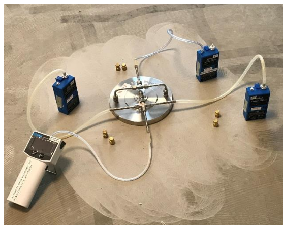
Kuva1. Flec-näytteenotto lattian betonipinnalta

Tilat 1.30 (Perhetupa) ja 1.31 valittiin kokeeksi mallihuoneeksi. Mallialueelta otettiin kaksi pintaemissionäytteenottoa (FLEC) puhdistetun betonin pinnalta.