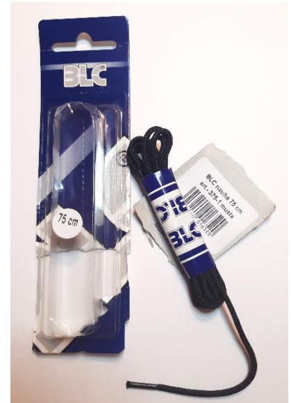
Ohuehkoa kengännauhaa esim. Tokmannilta.