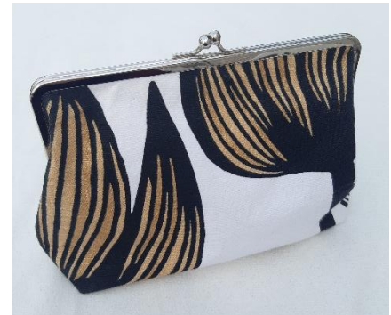
Pussukka peruskehyksessä. Ryhtiä tuomassa Vilene S320 tukikangas, jota on saatavilla mm. Ullakasta.