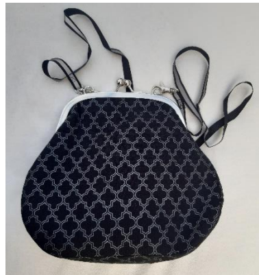
Laukkukehys. Tukimateriaalina Eurokankaan huopakovike liimalla.