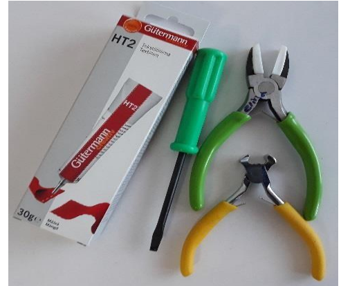
Gutermann HT2 liima, talttapäruuvimeisseli ja pihtejä.