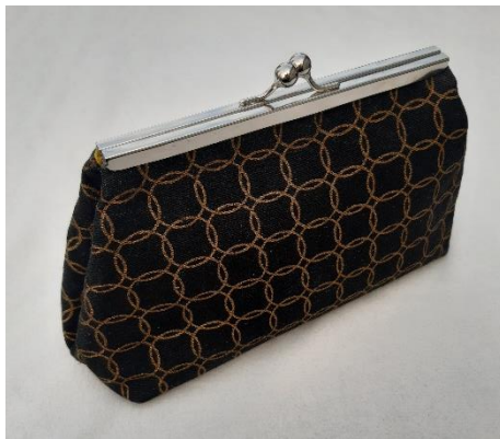
Laukku I-kehyksessä. Sisällä on taiteutuvat renkaat olkahihnan kiinnitykseen. Tukimateriaalina Eurokankaan huopakovike liimalla.