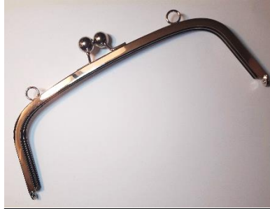
Perus laukkukehys. Renkasiin voi kiinnittää olkahihnan.