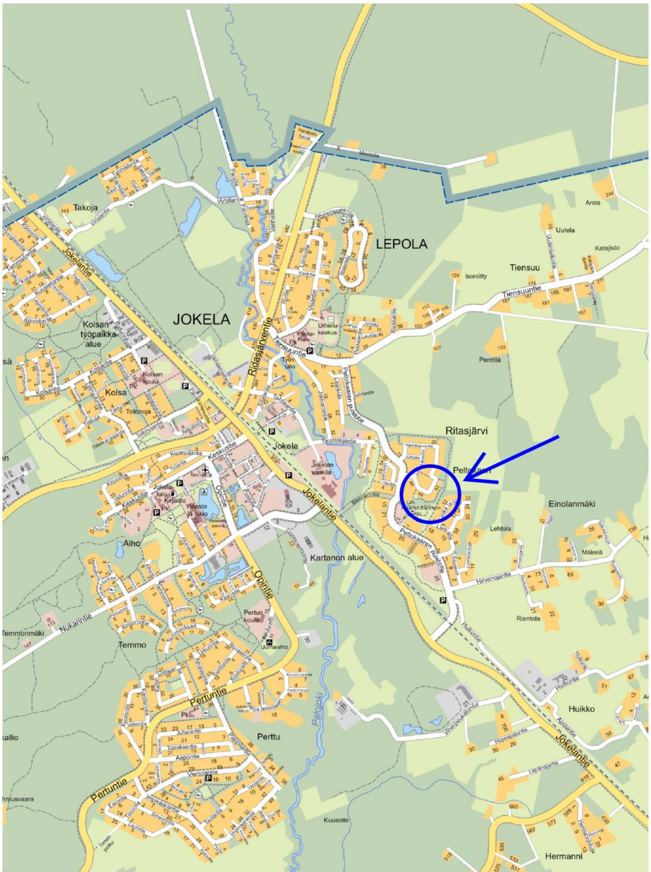
Ote opaskartasta, johon ko. alue rajattu