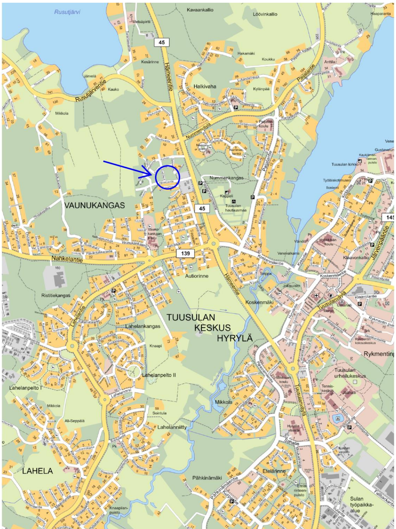
Ote opaskartasta, johon ko. alue rajattu