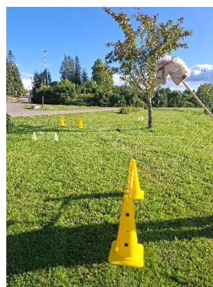
Otteita harrastusmessujen monipuolisesta annista.

Syyslomalla aika ei käynyt pitkäksi, sillä lomailijat pääsivät osallistumaan kaikille avoimeen palloilukerhoon, liikkumaan niin ulkona kuin sisäliikuntapaikoissa, tapaamaan kavereita, viettämään aikaa nuorisotiloilla sekä osallistumaan tapahtumiin.