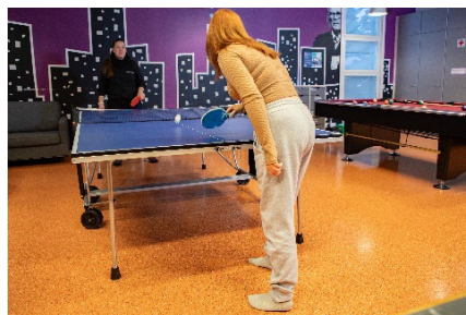
Syyslomalla pääsi pelaamaan pallopelejä, viettämään aikaa ulkona esimerkiksi frisbeegolfin parissa sekä tapaamaan kavereita ja ohjaajia nuorisotiloilla.

Lokakuussa kellokoskelaiset 12–15-vuotiaat kertoivat Skidialogissa , mitkä asiat tekevät Kellokoskesta kivan paikan viettää vapaa-aikaa. Mahtavien ideoiden toteutusmahdollisuuksia selvitettiin viipymättä!