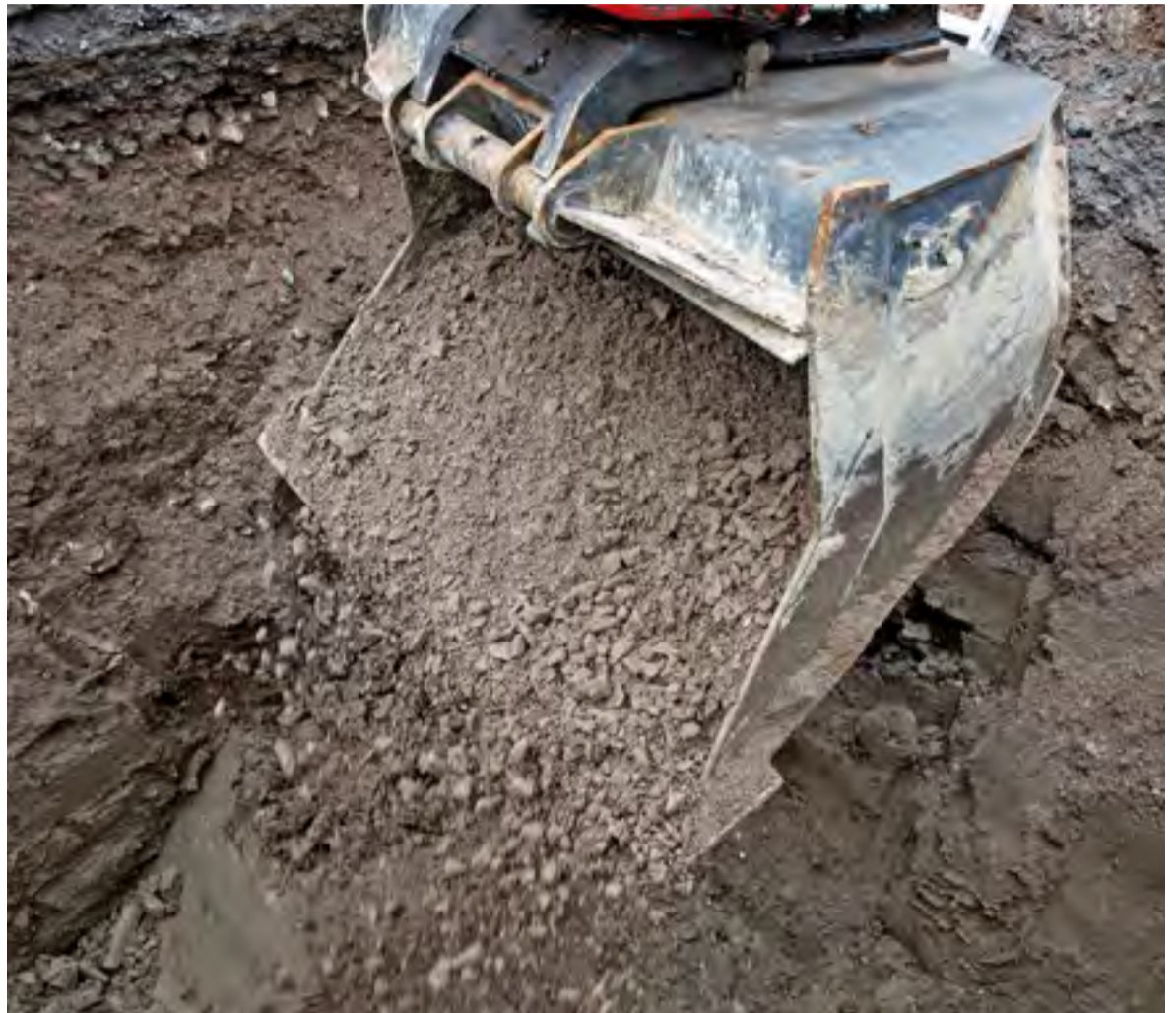
Hulevesien hallinta on otettava huomioon jo rakennushankkeen suunnitteluvaiheessa.

” Kiinteistön omistaja vastaa hulevesien hallinnasta omalla kiinteistöllään. ”