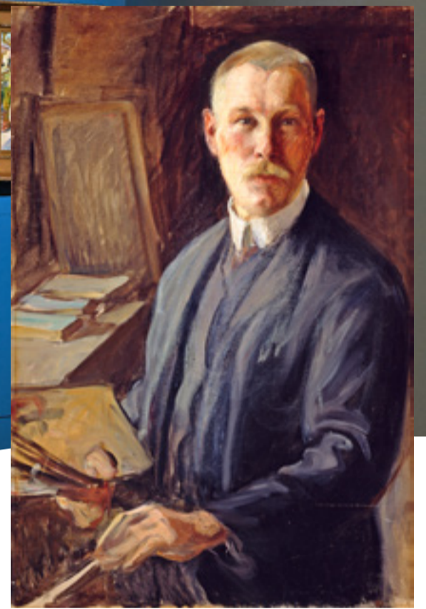
Pekka Halosen Omakuva 1890-luvulta, Halosenniemen museo

Pekka Halosen näyttely Een Oode aan Finland – Hymni Suomelle esillä Alankomaissa Enscheden kaupungissa.