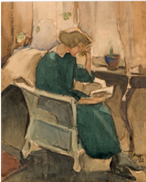
Martta Wendelin: Lukeva tyttö, 1922, Martta Wendelin Seuran kokoelma