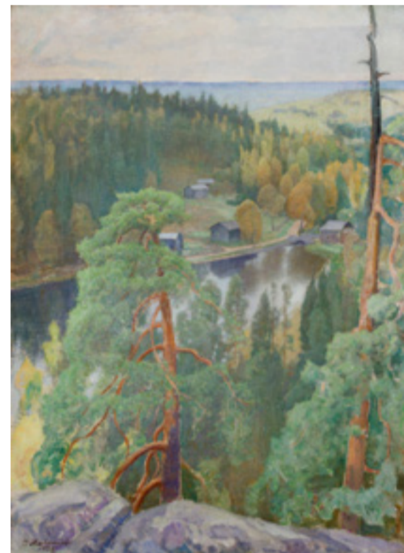
Pekka Halonen, Syysmaisema Kuhmoisista, 1928, Pekka Halosen seura

Nykypäivänä erämaan kaltaiset luonnontilaiset metsät sijaitsevat kansallispuistoissa ja suojelualueilla. Vanhat metsät toimivat turvapaikkana uhanalaisille lajeille, joten ikimetsien suojeleminen on tärkeää näiden eliölajien säilymisen kannalta. Kaupungeissa ihminen valtaa tilaa luonnolta. Samalla katoavat lintujen ja hyönteisten luontaiset elinolosuhteet. ●