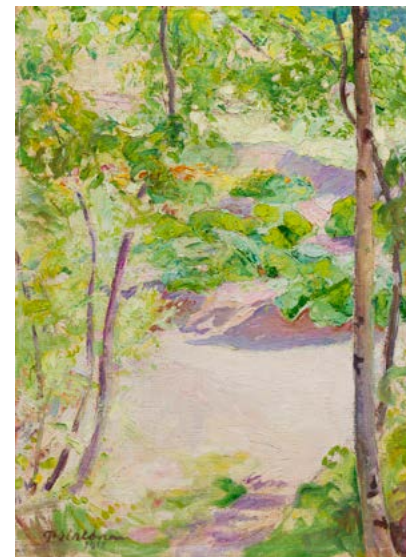
Pekka Halonen, Kesäkuun puutarhasta 1911, Halosenniemen museo.

Yleisöopastus sunnuntaisin suomeksi klo 14 ja englanniksi klo 15.