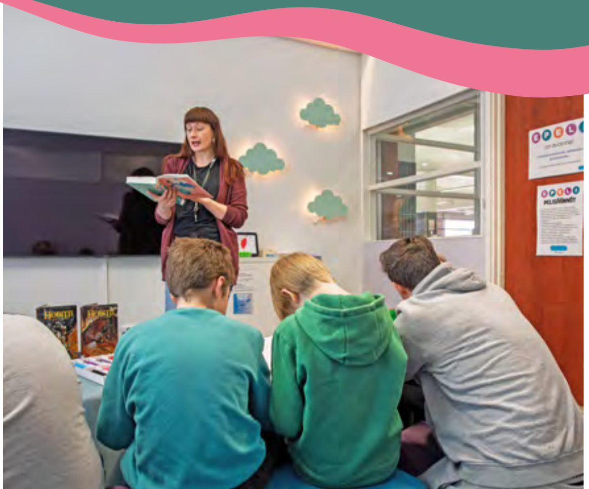
Moninaiset erityiset -hankkeen ytimessä on ajatus siitä, että lukeminen kuuluu kaikille.

Hankkeen pilottiryhmät ovat saaneet nauttia myös kirjaston vapaaehtoistyöntekijöiden panoksesta: kivana piristykseenä koulupäivään hankeryhmille on tarjottu lukumummin ja lukukoiran vierailuja. Rauhallisessa tilassa lukumummi lukee tarinaa