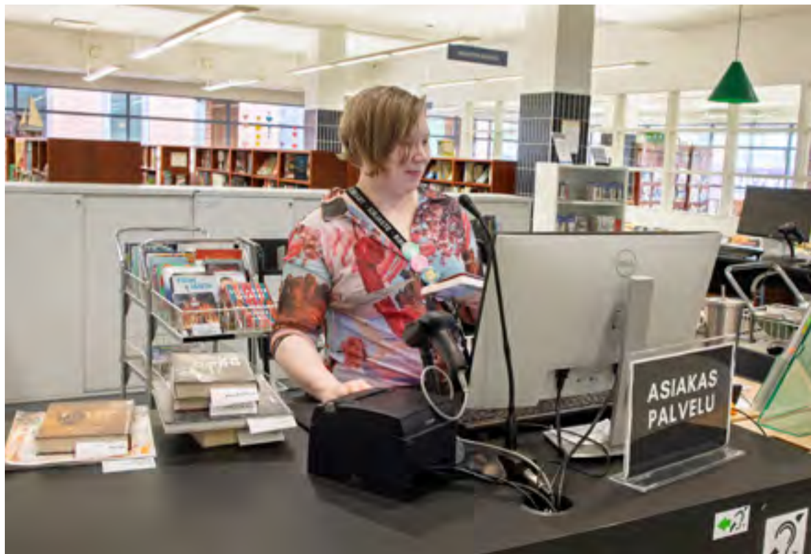
Kirjaston palvelut pyritään tarjoamaan normaalisti töiden aiheuttamista poikkeuksista huolimatta.

Tulevien korjaustöiden takia kirjasto voidaan joutua sulkemaan joksikin aikaa, ja sisään- ja uloskäynti on mahdollisesti hoidettava väliaikaisjärjestelyillä. Kirjaston palvelut pyritään kuitenkin tarjoamaan kuntalaisille mahdollisimman normaalisti töiden aiheuttamista poikkeuksista huolimatta. ●