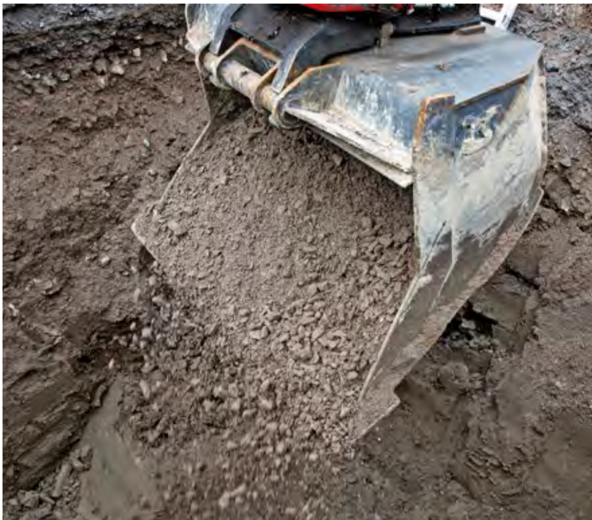
Hulevesien hallinta on otettava huomioon jo rakennushankkeen suunnitteluvaiheessa.

” Kiinteistön omistaja vastaa hulevesien hallinnasta omalla kiinteistöllään. ”