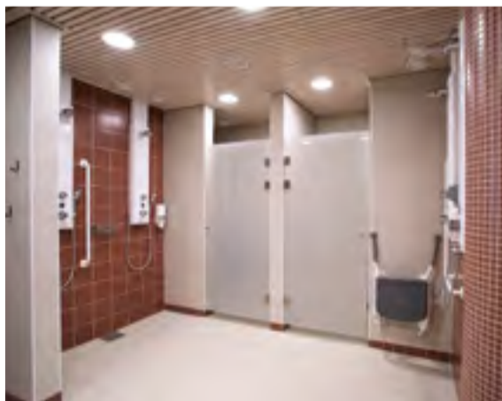
Peseytymistiloihin on rakennettu ovellisia suihkukoppeja, jotka tarjoavat aiempaa enemmän yksityisyyttä.

keessa on myös uusittu ja huollettu hallin laitteita, jotta tekniikka pelaa eikä aiheuta ylimääräisiä käyttökatkoksia tai muita huolia.